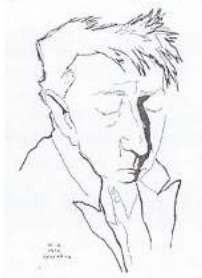
Юрий Анненков. Портрет Велимира Хлебникова (1916)

Художник, член объединения «Мир искусства», Юрий Анненков (1889–1974) в 1910–20-е годы создал целую галерею живописных и графических портретов многих политиков, деятелей искусства, литераторов. В их числе были два портрета поэтов Велимира Хлебникова и Владимира Маяковского. Позднее, уже в 1960-е годы, Анненков написал большой автобиографический труд «Дневник моих встреч» – это воспоминания об эпохе, свидетелем которой он был, и о людях, составлявших для него лицо этой эпохи. Выполняя задание, у Вас есть возможность сопоставить непосредственное впечатление, зафиксированное в графических портретах, и словесные портреты, написанные спустя продолжительное время после встречи художника с изображённым героем.