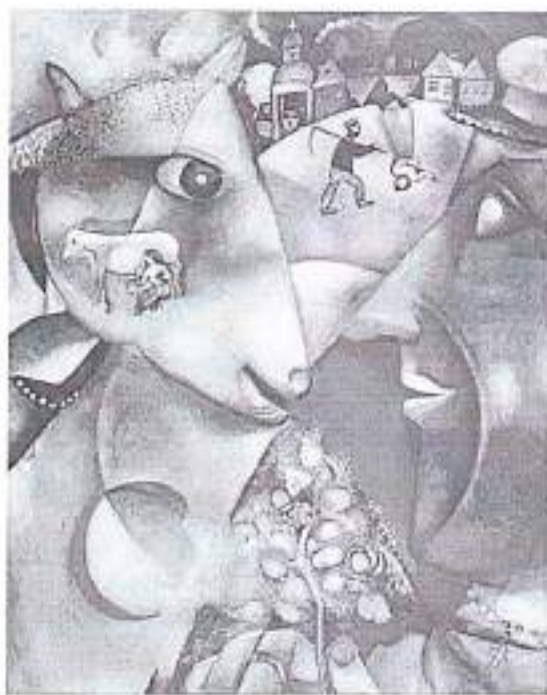
Г. М. Шаггал. Я и деревня. 1911

В этом задании Вам предстоит работать с картинами Бориса Григорьева (1886–1939) и Марка Шагала (1887–1985), подумать о том, какую роль в их произведениях играют взгляд героев, диалог глаз, образ «распахнутого» глаза. Картины «Я и деревня» и «Старуха-молочница» были написаны в близкое и вместе с тем радикально различное время. Шаггал пишет свою работу в 1911 году, во время, когда ещё ничто не предвещает Первую мировую войну. Это год его первой поездки во Францию, когда молодой художник осознаёт свою связь с культурой еврейского местечка в Витебске и одновременно открывает огромный новый мир артистического Парижа. Работа «Старуха-молочница» входит в цикл «Расея», созданный Григорьевым в 1917 – начале 1920-х годов. Этот цикл писался художником в разгар страшных событий в истории страны – гражданской войны и революции. Григорьев работал над ним в Санкт-Петербургской и Олонецкой губерниях, где сохранился не только патриархальный уклад жизни, но и острая связь с другим периодом гражданской смуты – временем церковного раскола, поскольку в эти места был сослан протопоп Аввакум.