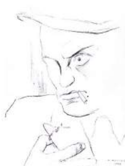
Юрий Анненков. Портрет Владимира Маяковского (1924)

Юрий Анненков. «Дневник моих встреч» (фрагменты)