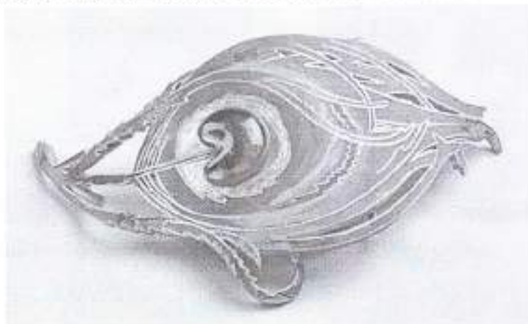
1. Пряжка «Павлиний глаз». Пилье Фререс. Начало XX века

эскизам выполнено в общей сложности 37 ювелирных изделий. Для этой брошки были выбраны очень дорогие материалы – платина, бриллианты и рубин, только глазное яблоко выполнено в синей эмали.