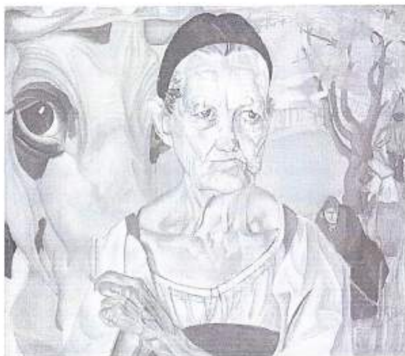
2. Б. Григорьев. Старуха-молочница. 1917 – нач. 1920-х гг.

Посмотрите на представленные работы и подумайте об их сходствах и различиях.