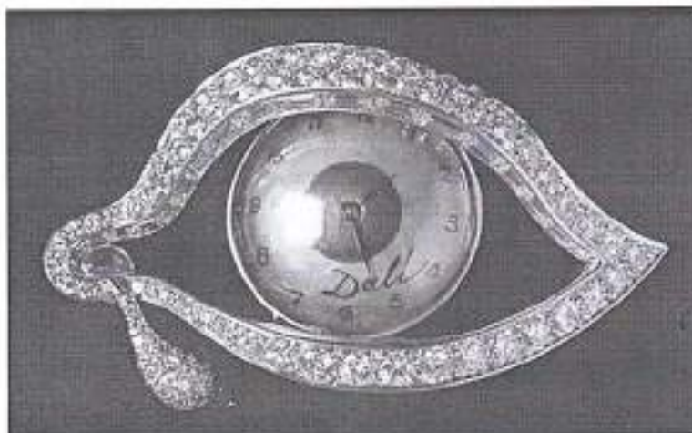
2. Брошь «Глаз времени». Сальвадор Дали, Карлос Алемани. 1949

Сравните украшения, представленные в задании. Для этого кратко сформулируйте сходства и различия в 7–10 предложениях. Обратите внимание на форму, цвет, линии, сочетание материалов, на названия украшений.