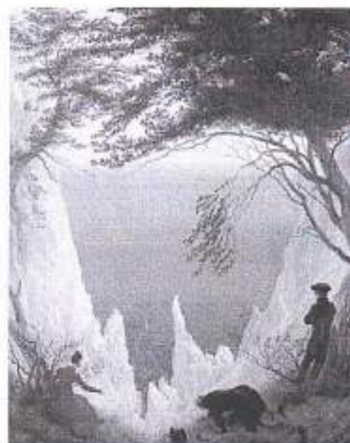
4. Каспар Давид Фридрих. Меловые скалы на острове Рюген. 1818

Внимательно посмотрите на источники и, опираясь на следующие вопросы и свои наблюдения, напишите небольшое связное рассуждение (минимальный объём – 200 слов) на тему «Роль живописных произведений К.Д. Фридриха в композиционном и образном решении сценического пространства в балете "Зимняя сказка" Кристофера Уилдона».