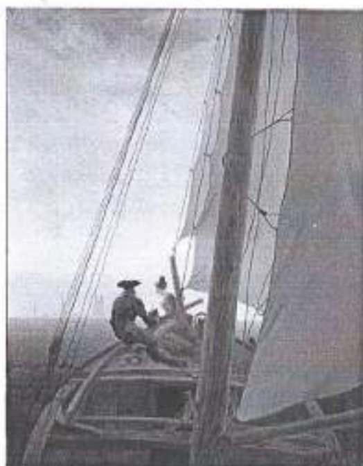
Каспар Давид Фридрих. На паруснике. 1818–1820