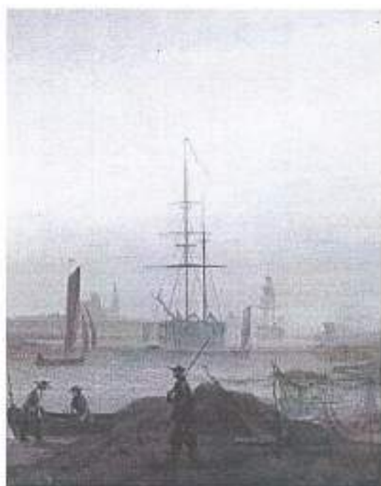
Каспар Давид Фридрих. Грайфсвальдская гавань. 1818–1820