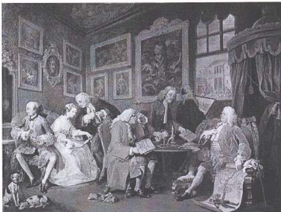
2. Уильям Хогарт. Серия «Модный брак». Брачный контракт. 1743–1745

Автор хотел высмеять брак по договорам и картины «Мушкетеры св. Лаврентия», «Убиение Авеля», «Любовь Медеуса Торговец» которые показывают, что брак не по любви это одно мнение и другая слова в названии картины указывают на это. Медеус Торговец на это девушка, которая превращена мушкетер в камень → картина имеет название отрицательный подтекст.