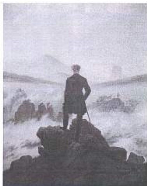
Каспар Давид Фридрих. Странник над морем тумана. 1818