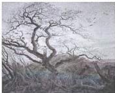
1. Каспар Давид Фридрих. Дерево с воронами; могильный курган у Балтийского моря и остров Рюген адали, или Дерево ворон. 1822

Обратите, пожалуйста, внимание, что в задании есть дополнительные материалы: фрагменты текста шекспировской пьесы и ещё несколько работ К.Д. Фридриха. Дополнительные материалы помогут вам подумать о философских и стилистических особенностях и разнообразии сюжетов живописи немецкого художника-романтика, а фрагменты пьесы дадут возможность поразмышлять над метафорической и образной структурой шекспировского текста и балета.