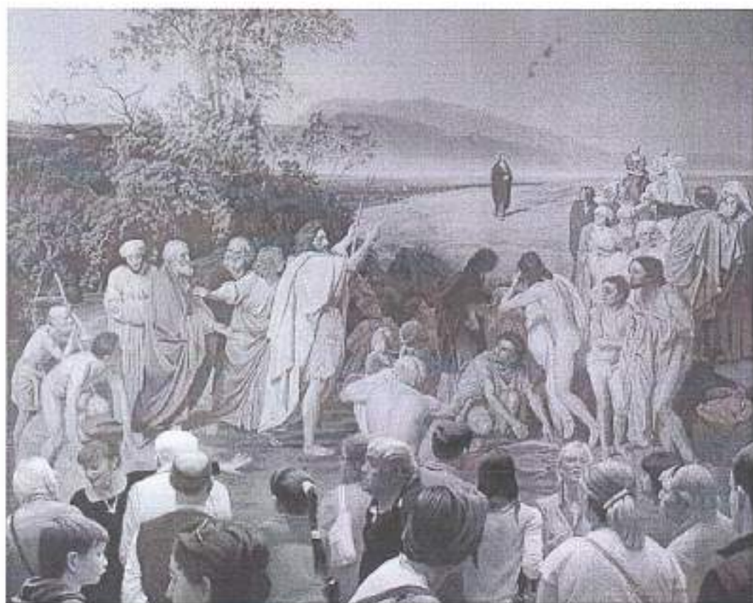
Э. Булатов. Картина и зрители. 2011–2013

В этом задании мы предлагаем Вам поработать с произведением современного искусства, созданным не так уж давно, – в 2011–2013 годах. Его автор – художник Эрик Булатов, мастер концептуализма и соцарта, активно работающий и сейчас. Обычно главный метод работы Булатова заключается в столкновении плакатного текста, изъятых из пространства лозунгов, и идиллического пейзажа, но в произведении, которое Вам предстоит анализировать, это не так. Предметом изображения здесь являются группы экскурсантов, стоящие в Третьяковской галерее перед картиной Александра Иванова «Явление Христа народу», на которой, в свою очередь, изображена толпа вокруг Иоанна Крестителя, указующего на Христа. На картине Булатова сталкиваются пространство музея и пространство картины; толпа, изображённая Ивановым и дополненная современным художником. К этой теме Булатов обращался не раз. Так, за несколько лет до создания картины он написал работу «Лувр. Джоконда», где главным героем стала толпа, взвращающая на музейный шедевр, символ классического искусства в целом. В работу «Картина и зрители» Булатов включает произведение, ставшее своего рода иконой русской живописи постпетровского периода, – «Явление Христа народу».