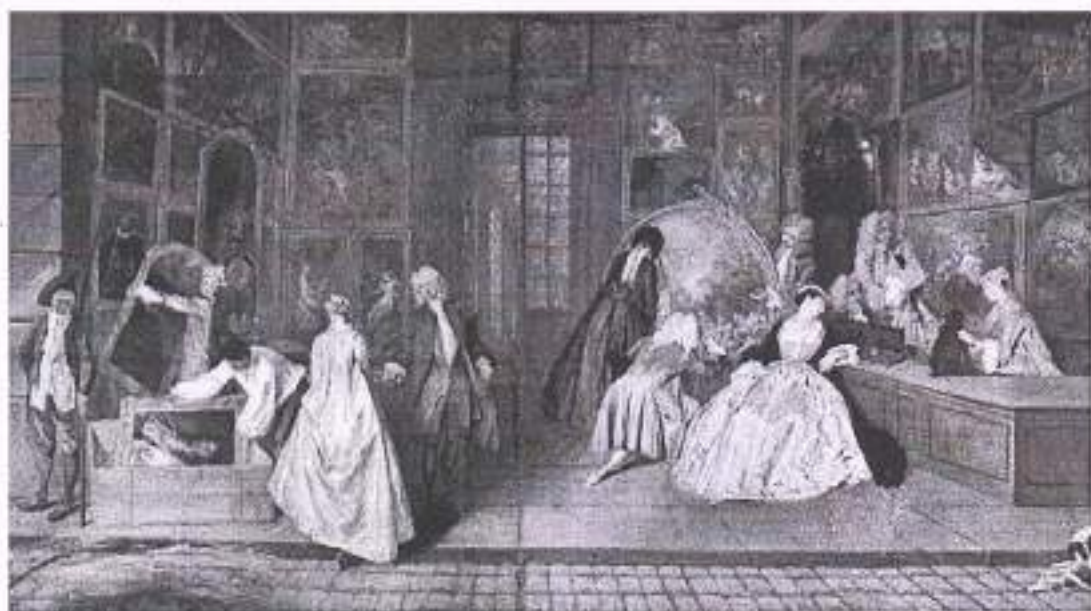
1. Антуан Ватто. Вывеска лавки Жерсена. 1720

художник Уильям Хогарт многократно использовал этот художественный приём в картинах из серии «Модный брак», в которой он высмеивал брак по расчёту, принятый в аристократических кругах. На картине «Брачный контракт», открывающей серию, мы видим отцов жениха и невесты, кичащихся один – своей родословной, другой – богатством, невесту, любезничающую с адвокатом, составляющим контракт, и жениха, любующегося собой в зеркале. Хогарт развесил по стенам комнаты, где заключается брачный контракт, много картин, сюжеты которых хорошо узнаваемы: «Давид и Голиаф», «Мученичество св. Лаврентия», «Юдифь и Олоферн», «Убиение Авеля», «Голова Медузы Горгоны». Художник русского авангарда Илья Машков часто включает в свои портретные композиции произведения восточных школ – японские гравюры, китайские ширмы, персидские миниатюры. Так, позади модели на картине «Дама в кресле», представленной в задании, Машков, вероятно, располагает сильно увеличенные в размере сцены из Исфаханских миниатюр. Подумайте, какую роль в каждом произведении играют включённые в него живописные произведения. Для ответа на вопрос коротко (в трёх-четырёх предложениях) сформулируйте комментарии к каждой из трёх картин, в которых раскройте значение произведений искусства в её структуре.