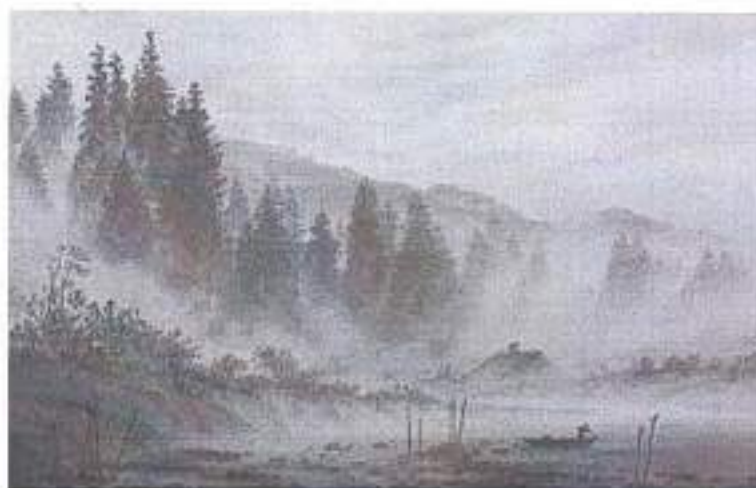
3. Каспар Давид Фридрих. Утро. 1820–1821