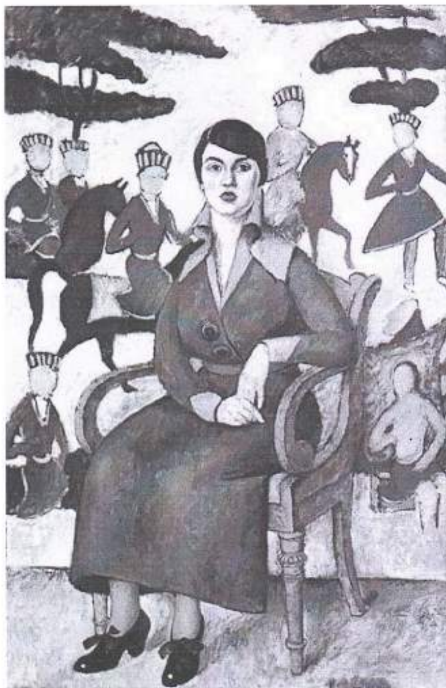
3. Илья Машков. Портрет дамы в кресле. 1913