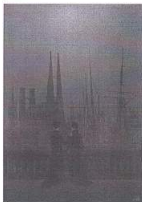
Каспар Давид Фридрих. Ночь в гавани. 1818–1820