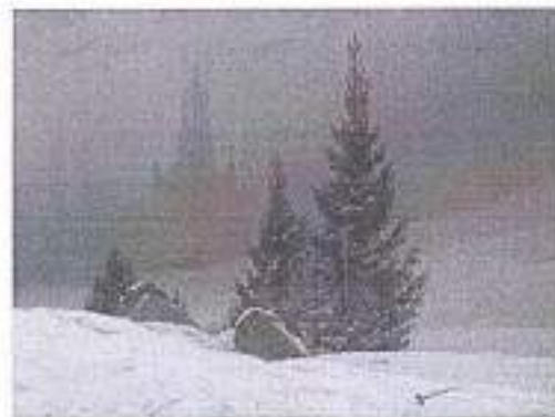
2. Каспар Давид Фридрих. Зимний пейзаж с церковью. 1811