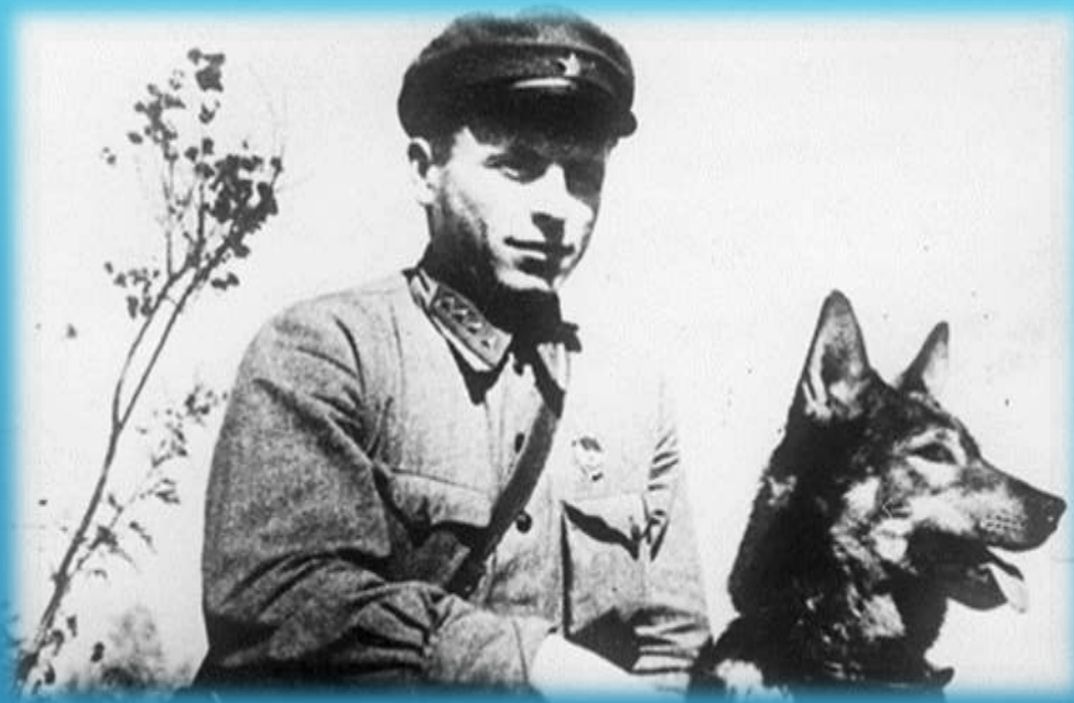
Знаменитый пограничник Никита Федорович Карацупа со своим верным псом Индусом

Прославился созданием своей особой школы воспитания следопытов и дрессировки собак. За 20 лет службы в погранвойсках задержал 338 нарушителей границы и уничтожил 129 шпионов и диверсантов, не сложивших оружие.